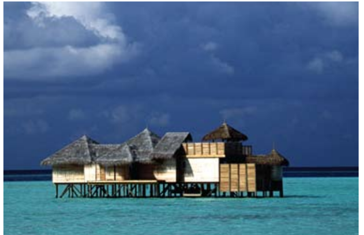
Soneva Gili Crusoe Residence