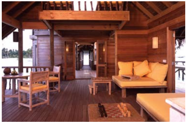
Soneva Gili Villa Suite (Interior)