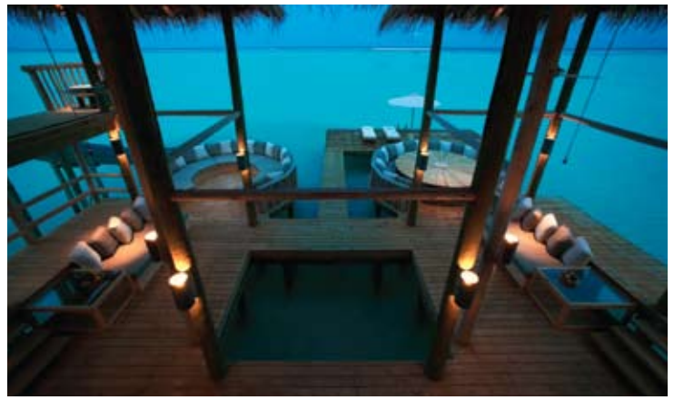
Private Reserve (Interior)