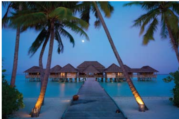
Six Senses Spa