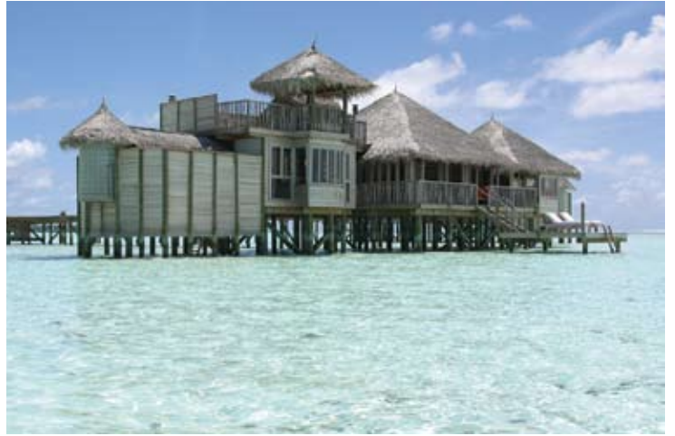
Soneva Gili Residence